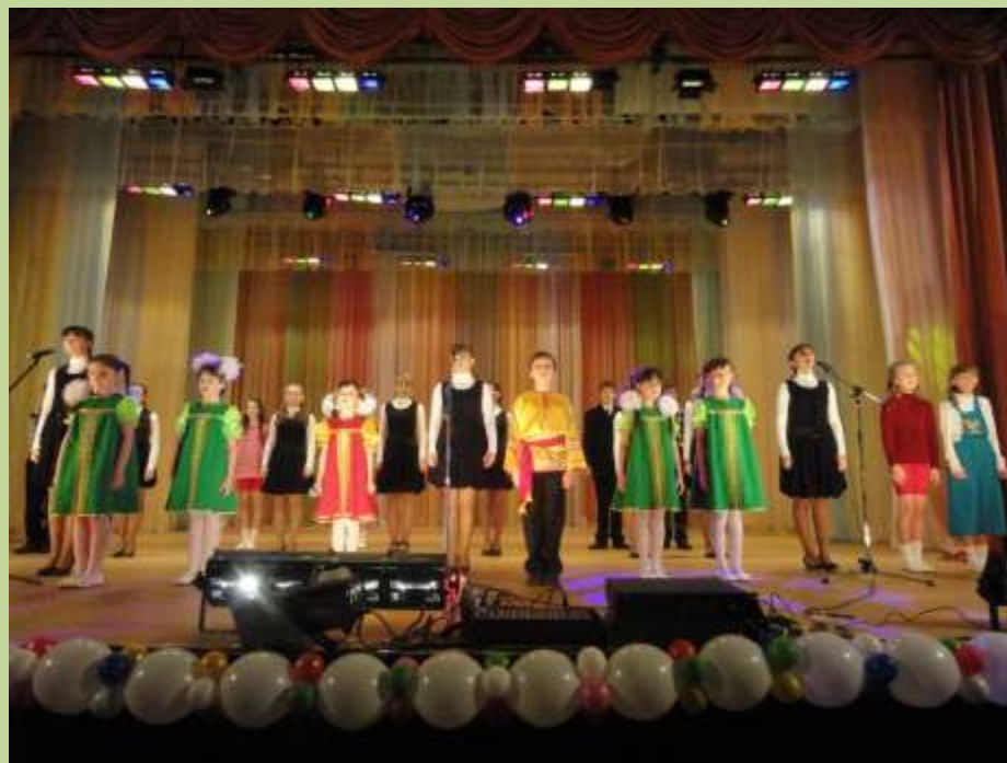
Областной смотр «Мы все можем»