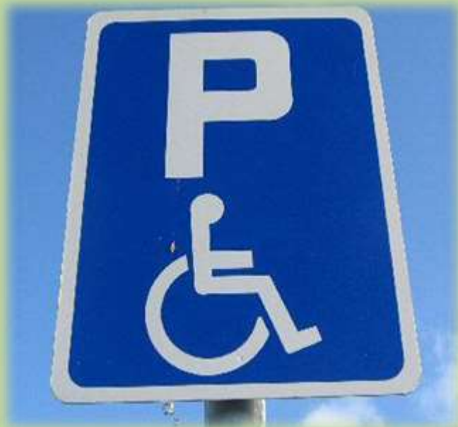
Знак парковки для инвалидов