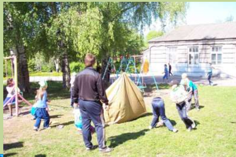
Традиционный туристический слет