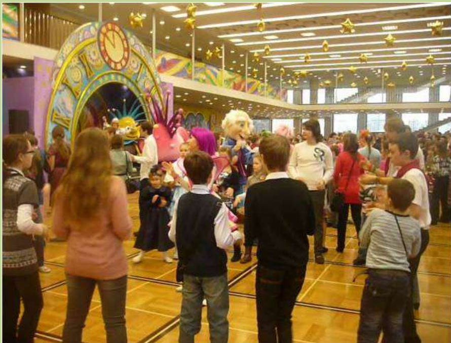
Елка в Кремле