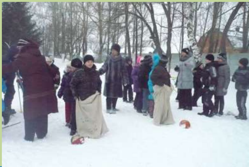
Зимний день здоровья