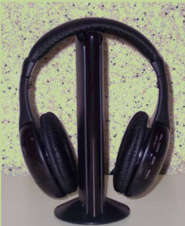
ИК – наушники беспроводные (расстояние 10 метров)