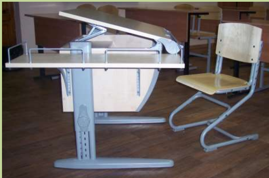
Учебный класс – парта «Дэми» для детей с ОВЗ