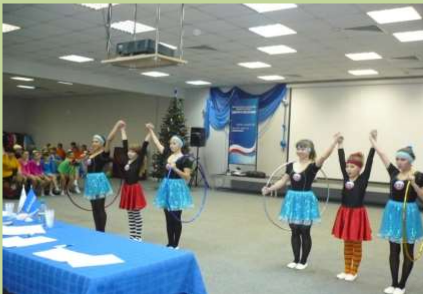
Областные соревнования по ритмике