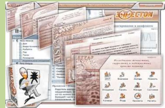
Диагностические программы для психолога «Эффектон-студии»