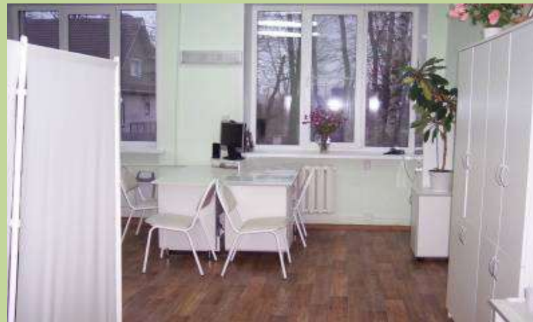
Кабинет медицинских сестер