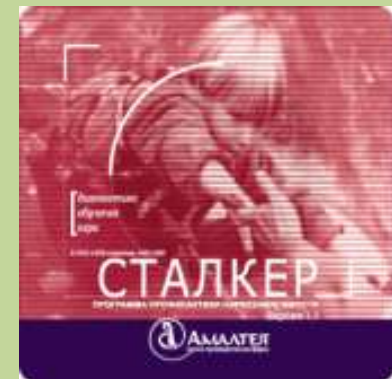
Образовательная программа «Сталкер» по профилактике ПАВ