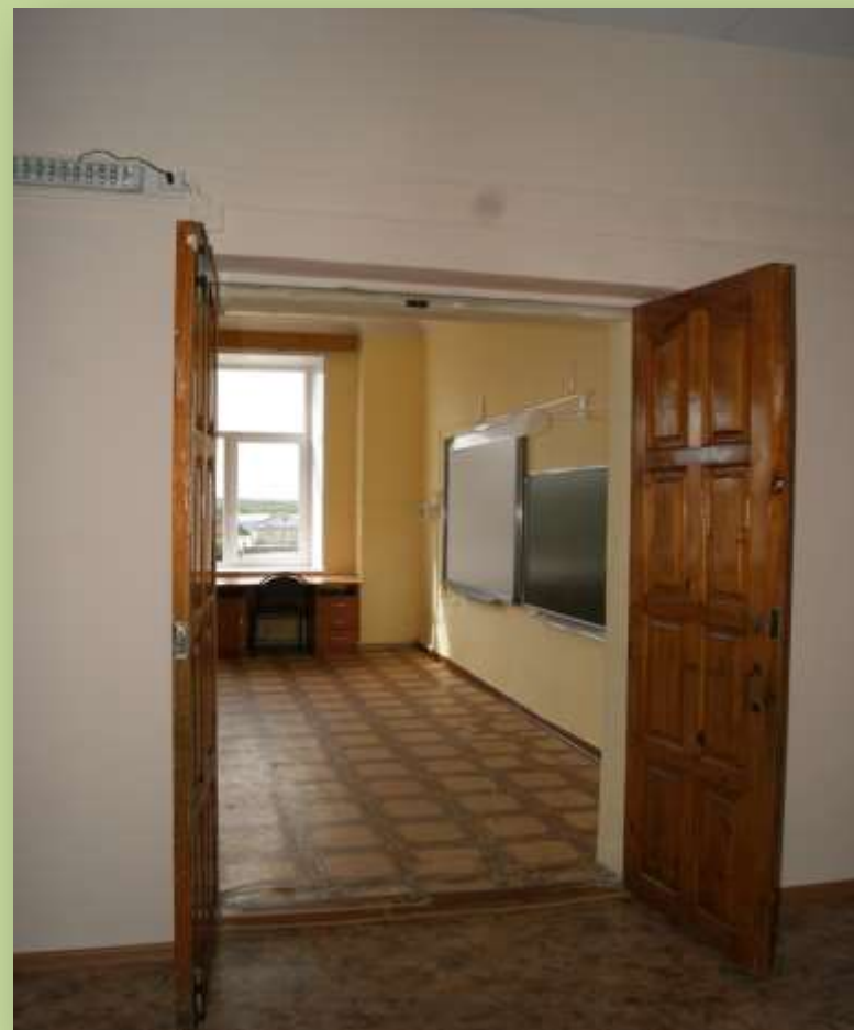
Учебный корпус – вход в класс