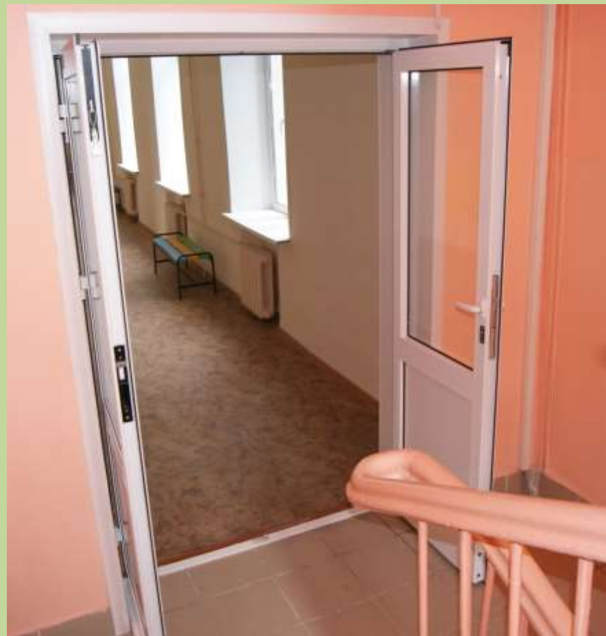
Вход в учебный корпус