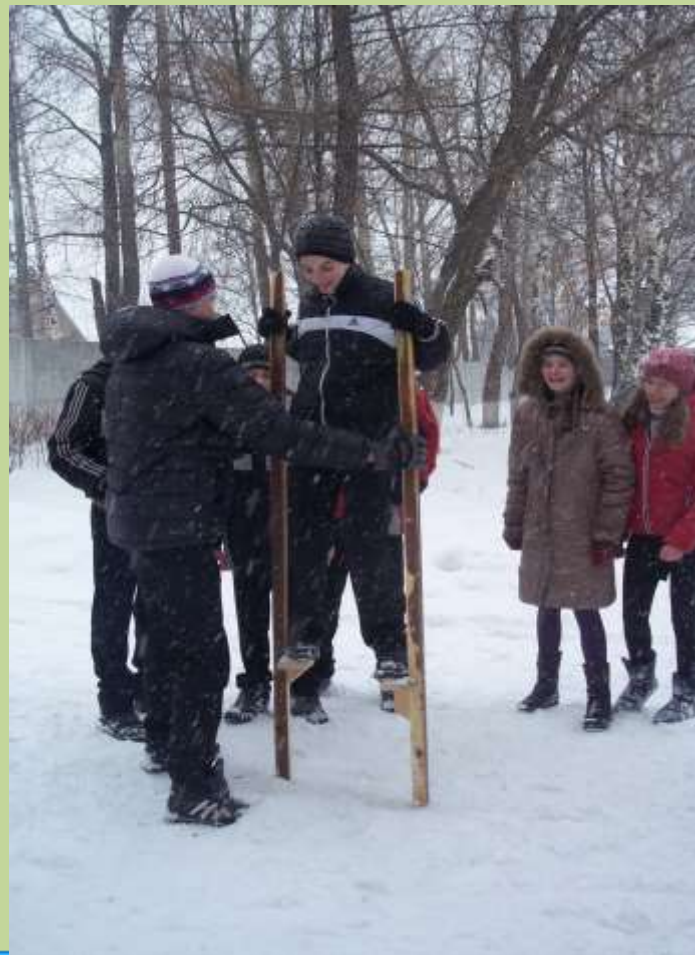
Проводы зимы «Масленица»