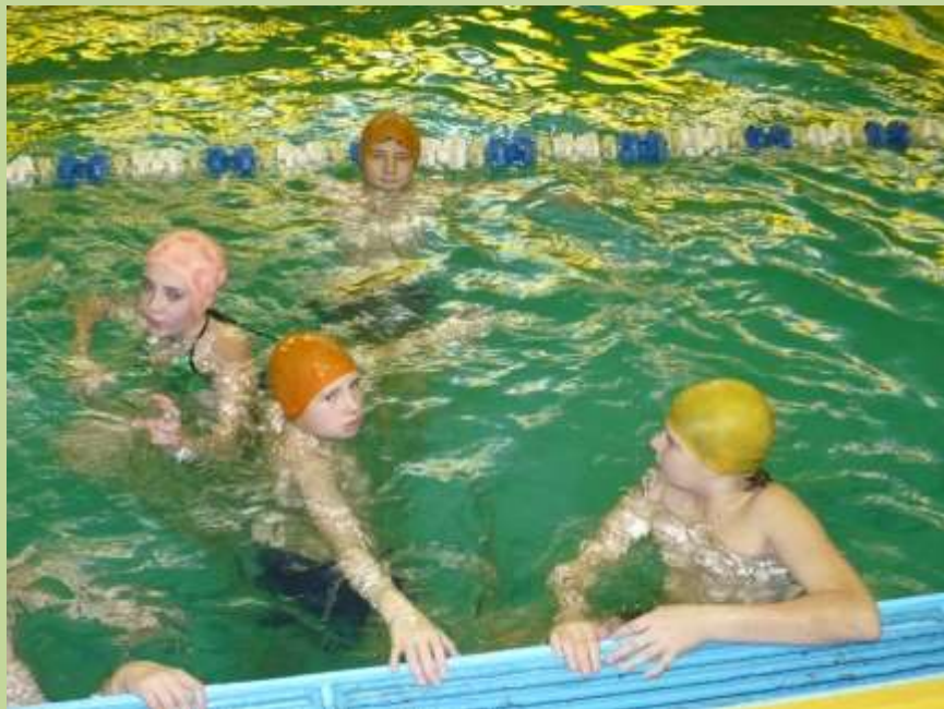
Посещение бассейна в ФОК г. Вязники