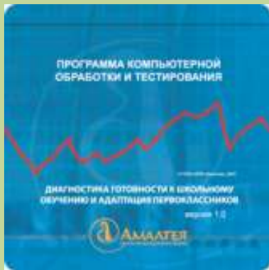
Блок психологических тестов «Диагностика первоклассников»