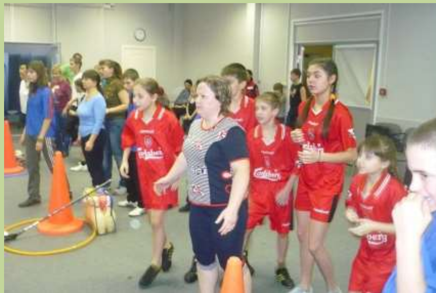
Областные соревнования "Воспитатель, я - спортивная семья"

Ежегодно воспитанники школы принимают активное участие в городских и областных спортивных мероприятиях.