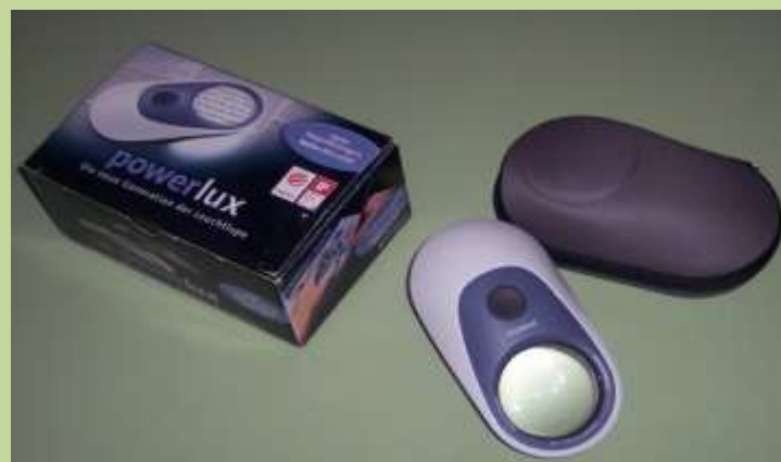
Увеличительная лупа (5 –кратное увеличение)