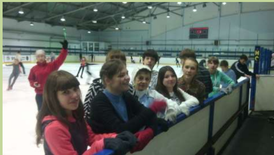
Дворец спорта п. Мелехово, Ковровский район