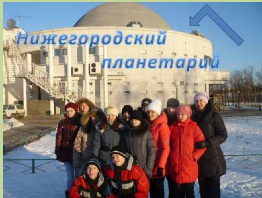
Экскурсия в Нижний Новгород