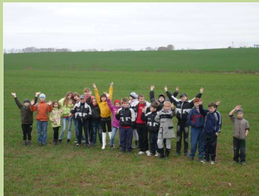
Лечебно-оздоровительный комплекс «Решма», Ивановская область