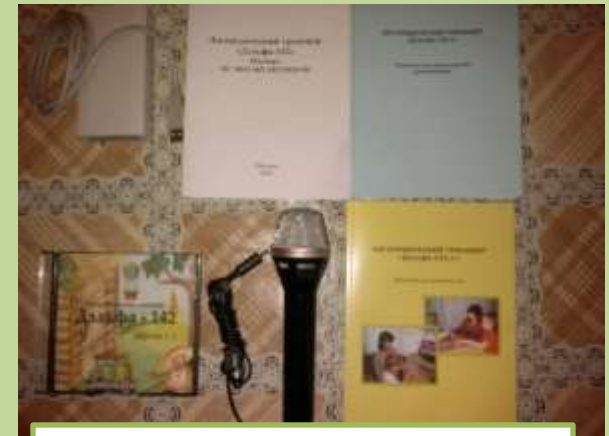
Логопедический тренажер «Дельфа-142.1»