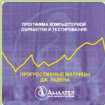
Программа компьютерной обработки «Прогрессивные матрицы Равена»