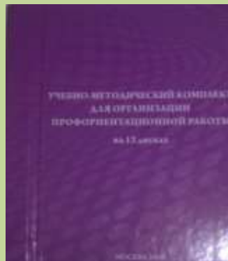
Учебно-методический комплект для организации профориентационной работы