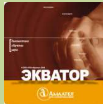
Профилактическая программа «Экватор»