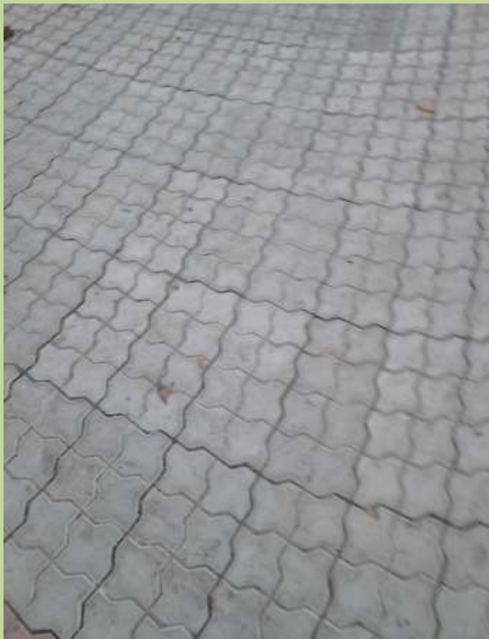
Уличная плитка перед входом в здание школы