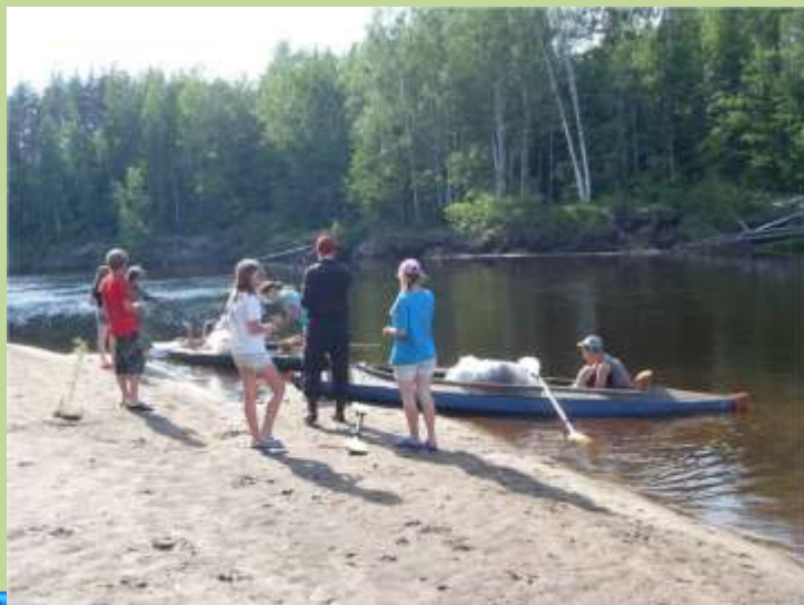
Водный поход на байдарках