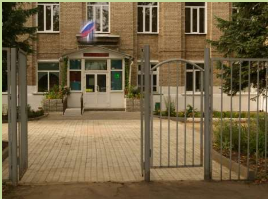
Вход на территорию школы-интерната