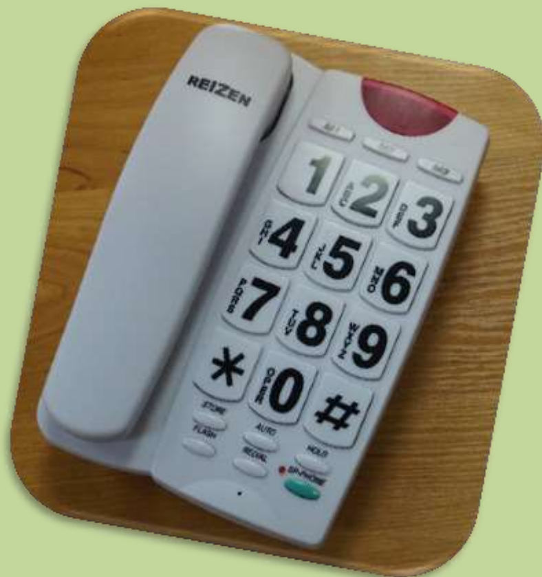
Телефон стационарный с большими кнопками