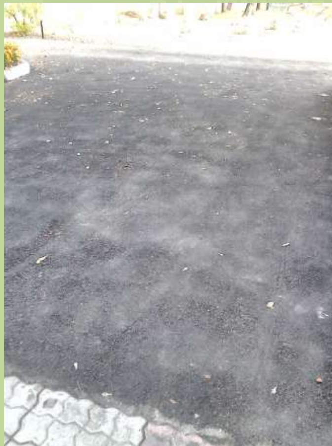
Асфальт вокруг здания школы