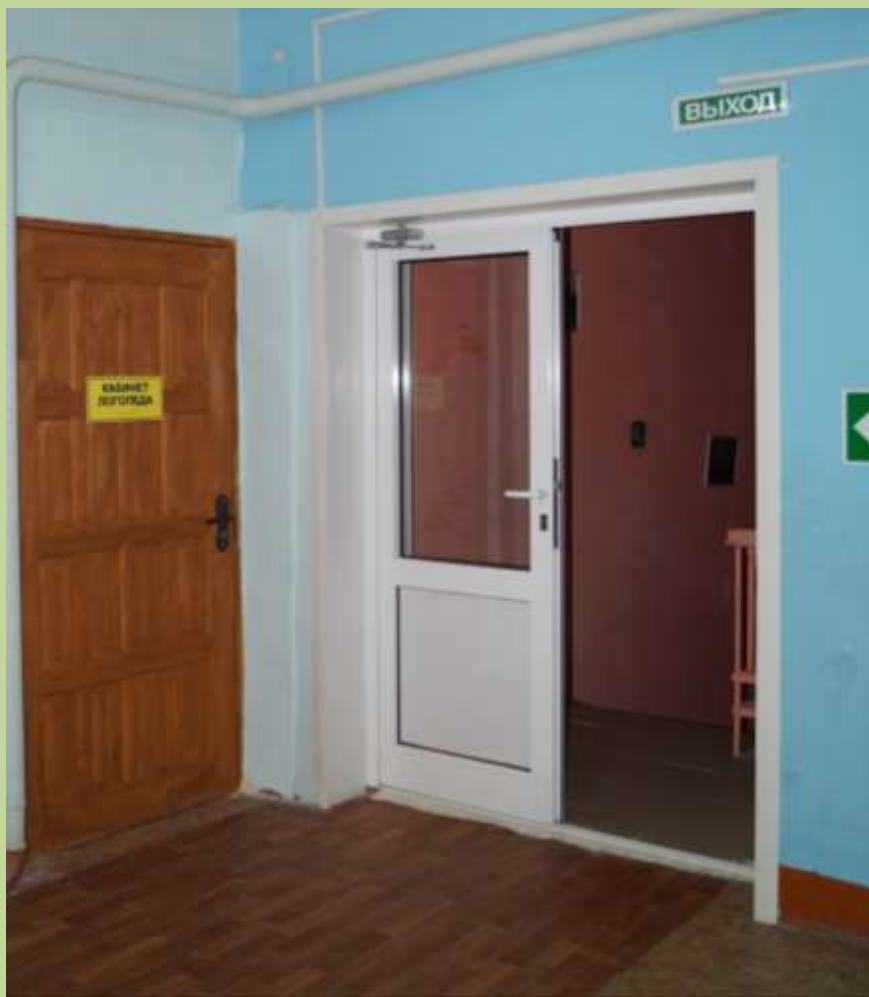
Учебный корпус – 3 этаж