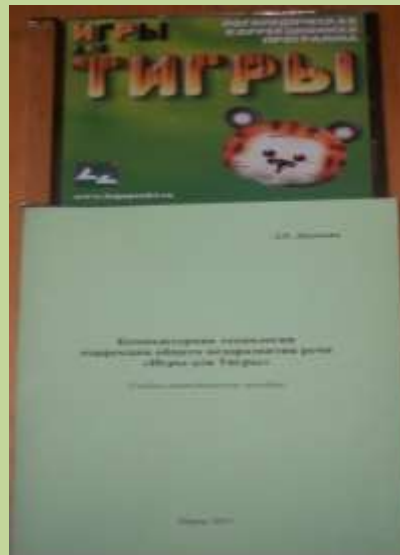
Программа «Игры для тигры»