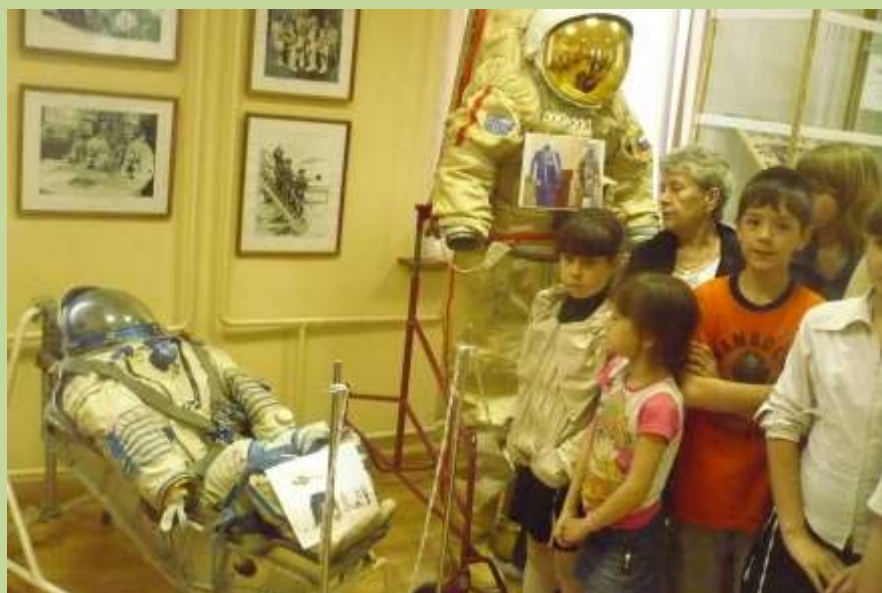
Выставка в Центре подготовки КОСМОНАВТОВ