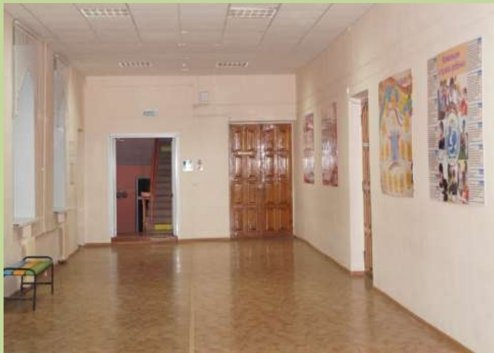
Учебный корпус – 2 этаж