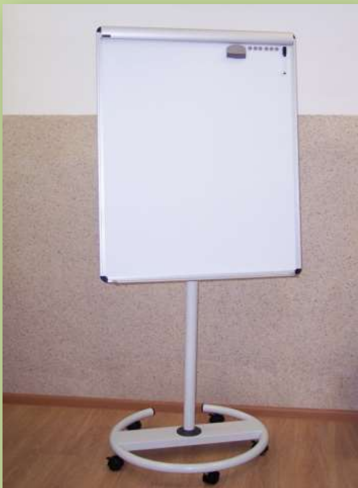
Доска - флипчарт