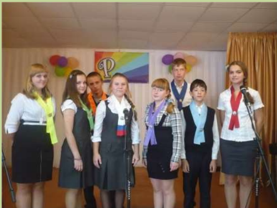
Прием в ДТС «Радуга»