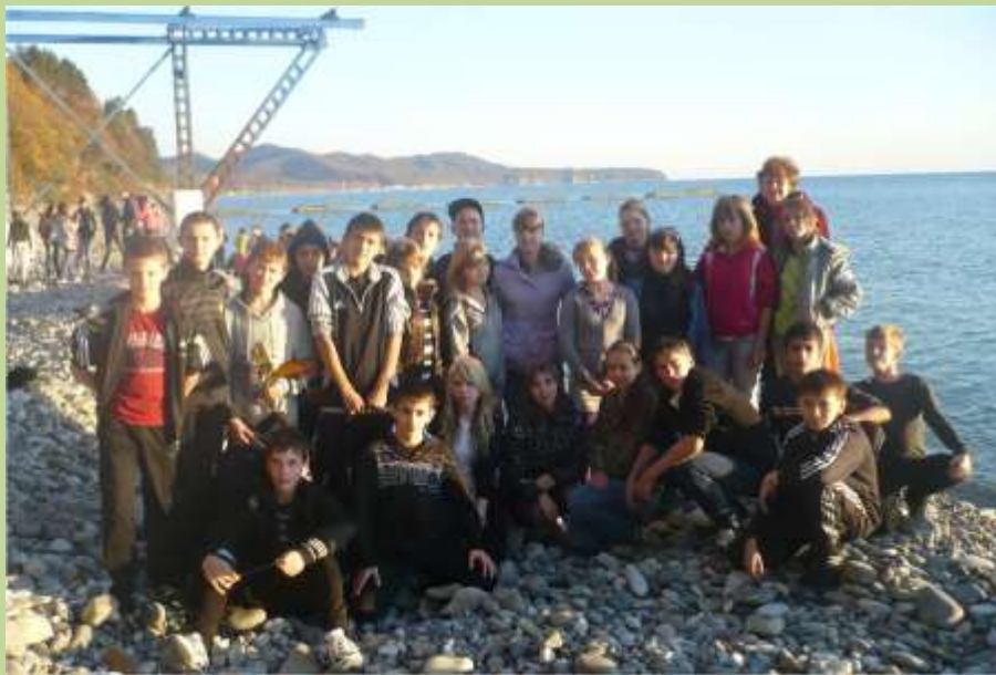
Санаторно-оздоровительный лагерь «Зорька», Краснодарский край