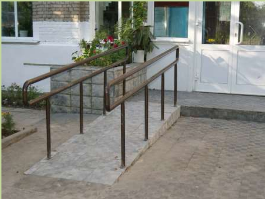
Стационарный пандус у входа в школу